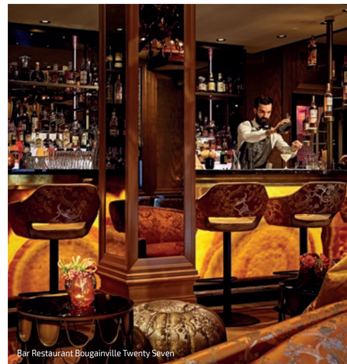
Bar Restaurant Bougainville Twenty Seven